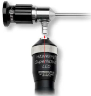
Fig. 1 Unscrewing of the LED lamp to an endoscope