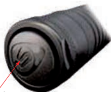
Fig. 7 Multi-function push-button