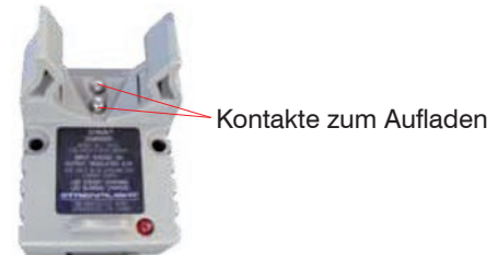
Abb. 4 Kontakte in der Ladestation