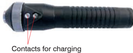
Fig. 3 Contacts at the LED lamp

➡ Plug the charger into the appropriate power outlet, see Fig. 2 .