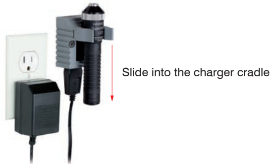
Fig. 2 Loading

The SuperNova LED must be fully charged (preferably overnight) before the first use.