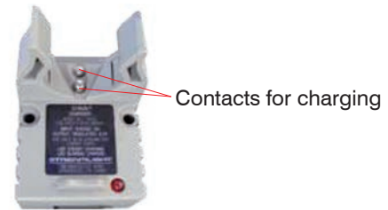
Fig. 4 Contacts in the charger