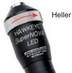
Abb. 8 Lichtintensität einstellen