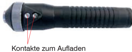
Abb. 3 Kontakte an der LED-Lampe

➡ Schließen Sie das Ladegerät an eine geeignete Steckdose an, siehe Abb. 2 .