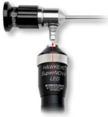
Abb. 1 Aufschrauben der LED-Lampe auf ein Endoskop