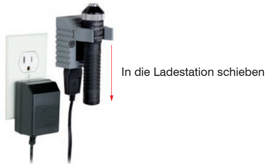
Abb. 2 Ladevorgang

Die SuperNova LED muss vor der ersten Verwendung vollständig (am besten über Nacht) aufgeladen werden.