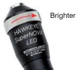
Abb. 9 Adjust light intensity