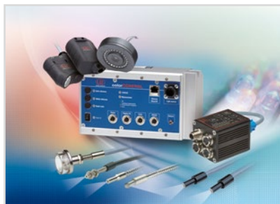
Sensoren zur Farberkennung, LED Analyser und Inline-Farbspektrometer