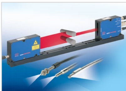
Optische Mikrometer, Lichtleiter, Mess- und Prüfverstärker