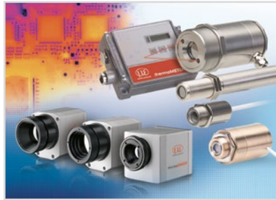
Sensoren und Messgeräte für berührungslose Temperaturmessung