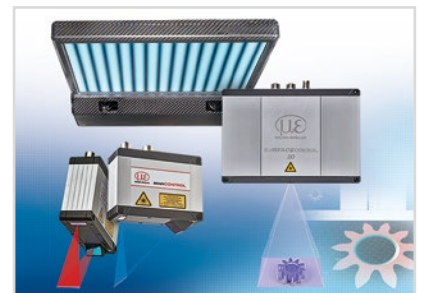
3D Messtechnik zur dimensionellen Prüfung und Oberflächeninspektion