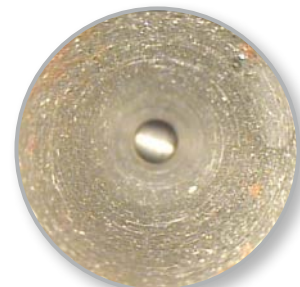
Ablagerungen im Rohr