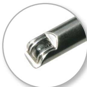
Schwenkprisma des MKF-D