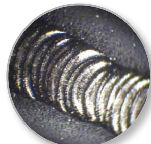
Prüfen einer Schweißnaht