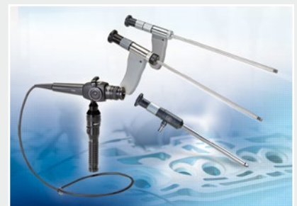
Technische Endoskopie, Lichtquellen