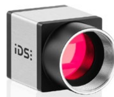
Endo CU &lt;&lt; 1/2,3" 18 MP