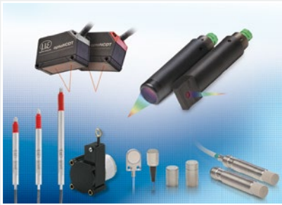
Sensoren und Systeme für Weg, Position und Dimension