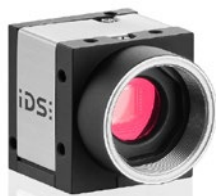
Endo CU1/3" 1,3 MP