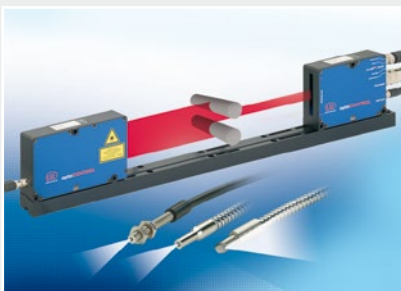
Optische Mikrometer, Lichtleiter, Mess- und Prüfverstärker