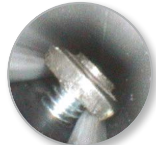
Sitz einer Schraube