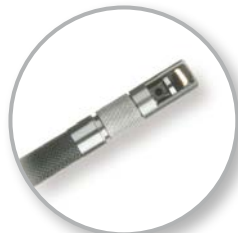
90° Prismenkopf (optional)