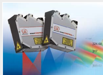
Capteurs de profil à ligne laser par triangulation 2D/3D