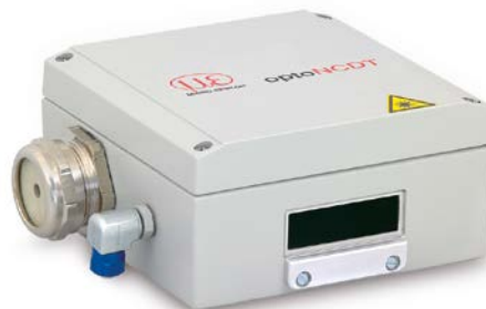
SGHx ILD taille S (140x140x71 mm) pour optoNCDT 1750 / 2300 dimensions 97x75 mm

Débit d'eau min. Q(\text{min}) = 3\text{ litres/min}