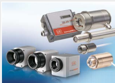
Capteurs et systèmes de mesure de température sans contact (pyromètres)