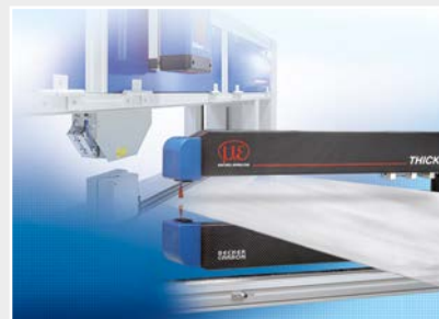
Installations de mesure et de contrôle pour l'assurance qualité