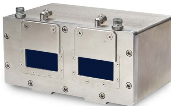
SGHx ILD taille M (140x180x71 mm) pour optoNCDT 1750 / 2300 dimensions 150x80 mm