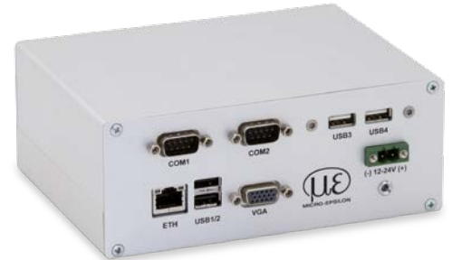
thermoIMAGER TIM NetPC