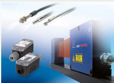
Optische Mikrometer, Lichtleiter, Mess- und Prüfverstärker