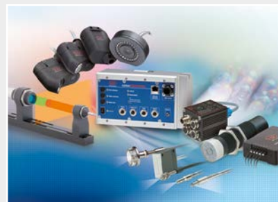
Sensoren zur Farberkennung, LED Analyser und Inline-Farbspektrometer