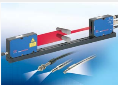
Optische Mikrometer, Lichtleiter, Mess- und Prüfverstärker