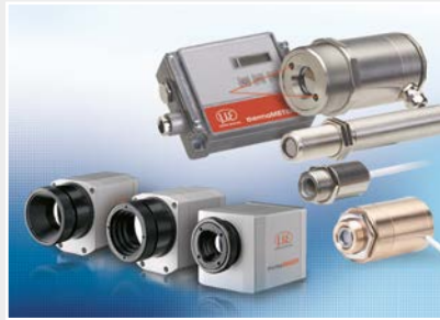
Sensoren und Messgeräte für berührungslose Temperaturmessung