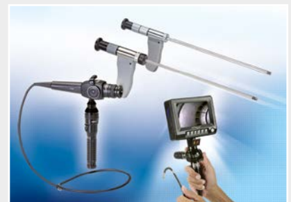
Technische Endoskopie, Lichtquellen