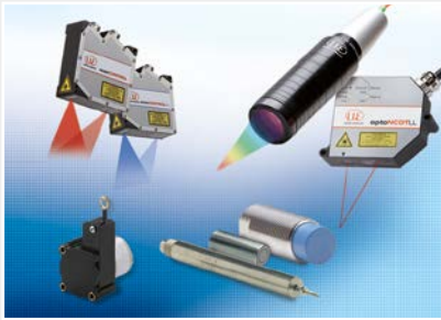
Sensoren und Systeme für Weg, Position und Dimension