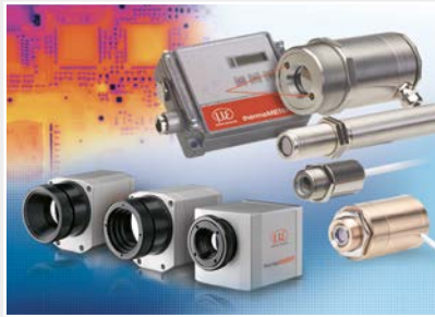
Sensoren und Messgeräte für berührungslose Temperaturmessung