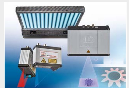
3D Messtechnik zur dimensionellen Prüfung und Oberflächeninspektion