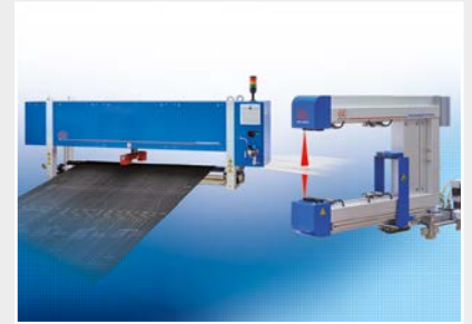
Systèmes de mesure et d'inspection pour les métaux, le plastique et le caoutchouc