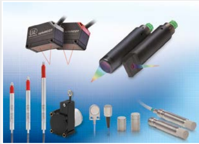
Capteurs et systèmes pour le déplacement, la distance et la position