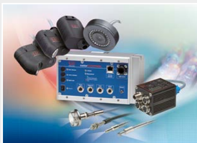
Capteurs pour la détection des couleurs, analyseurs DEL et spectrophotomètres