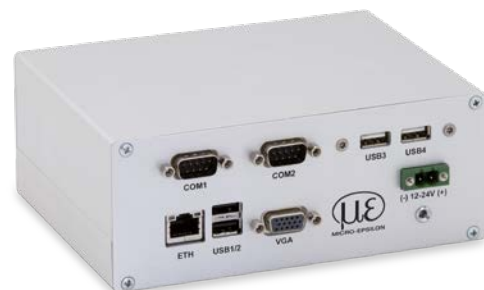
thermoIMAGER TIM NetPCQ

La caméra TIM NetPCQ est une solution PC professionnelle, industrielle et intégrée à refroidissement passif (sans ventilation), dédiée aux applications thermoIMAGER. Sa construction compacte permet le montage sur rail DIN. Le NetPCQ et la caméra TIM peuvent fonctionner en tant que solution autonome. L'interface Ethernet permet une maintenance à distance. Les données fournies par la caméra TIM peuvent être directement mémorisées sur le NetPCQ. En outre, le NetPCQ permet d'installer le logiciel spécifique à l'utilisateur. Le contenu de livraison comprend un clé de restauration.