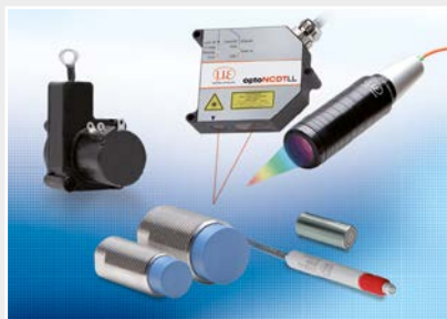
Capteurs de déplacement, de distance, de longueur et de position