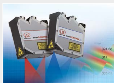
Capteurs de profil à ligne laser par triangulation 2D/3D