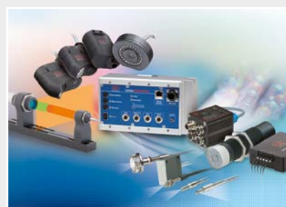
Capteurs de couleurs pour DEL et surfaces