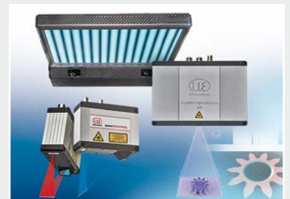
3D Messtechnik zur dimensionellen Prüfung und Oberflächeninspektion