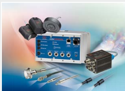
Sensoren zur Farberkennung, LED Analyser und Inline-Farbspektrometer