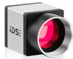
Endo CU &lt;&lt; 1/2,3" 18 MP